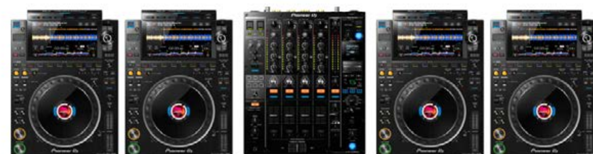
CDJ3000 CDJ3000 DJM900 NXS2 CDJ3000 CDJ3000